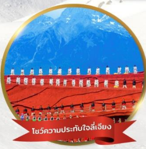
โชว์ความประทับใจลี่เจียง