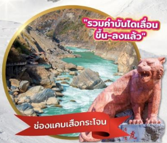
"รวมค่าบันไดเลื่อน ขึ้น-ลงแล้ว"